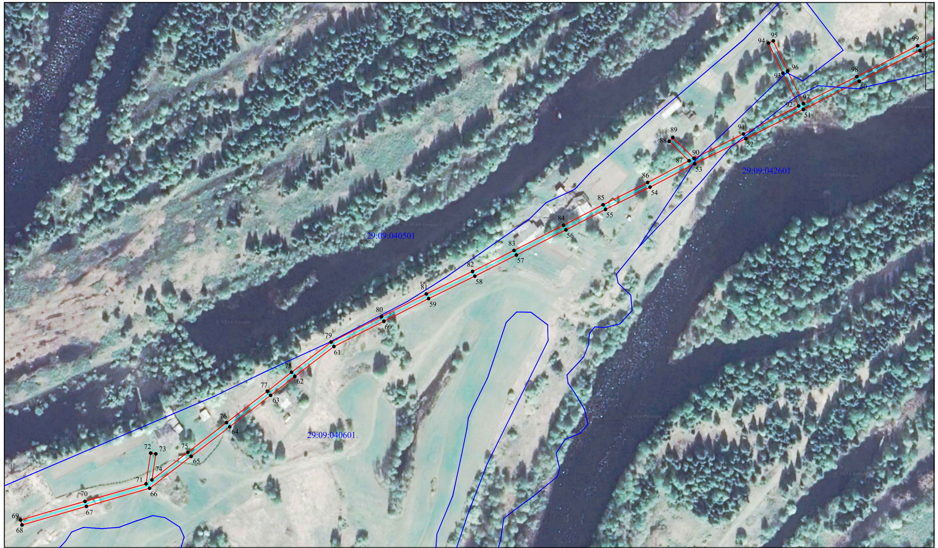
Схема расположения границ публичного сервитута объекта электросетевого хозяйства: «ВЛ-0,4кВ колхоз им.Кирова»,