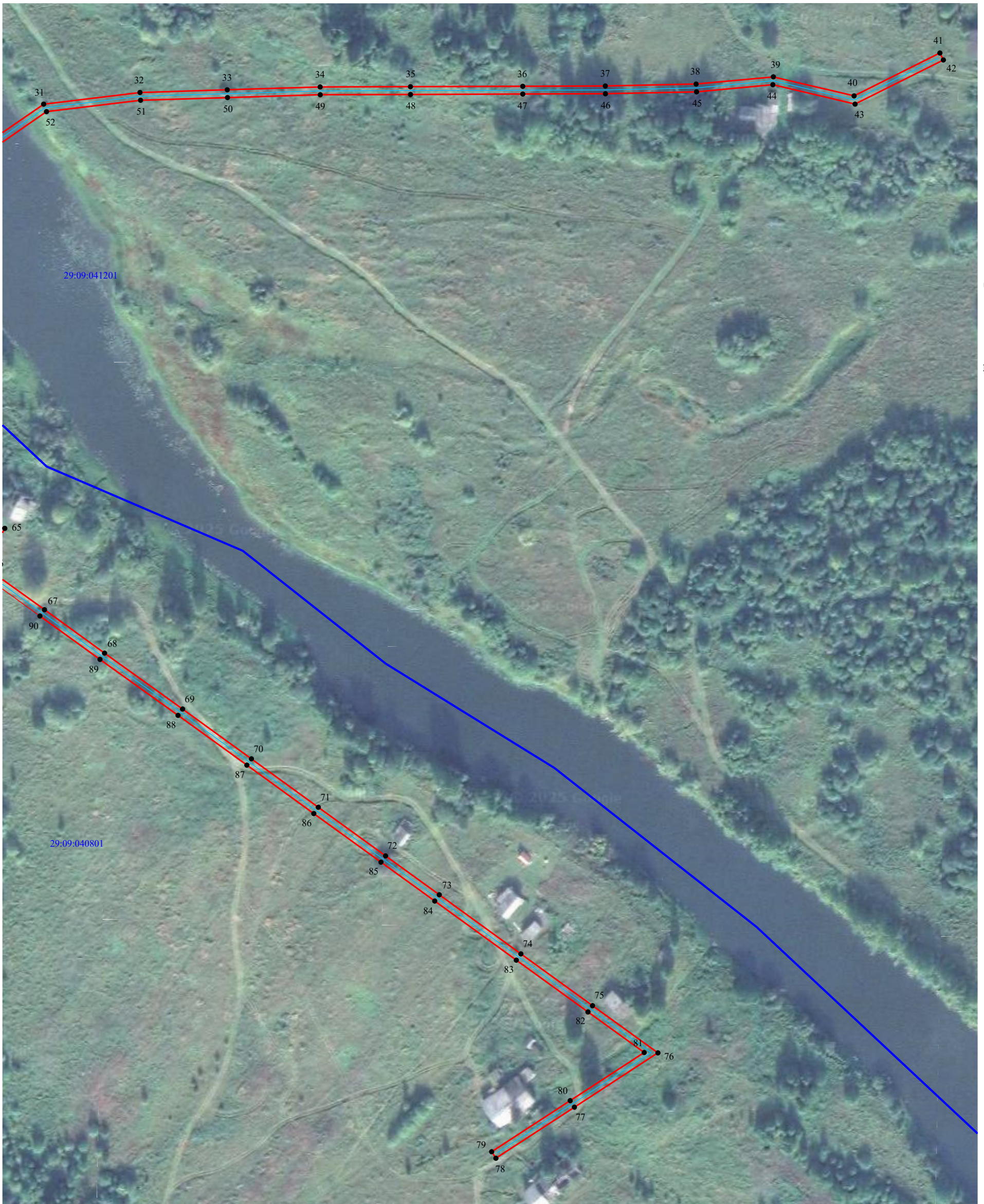
Схема расположения границ публично сервитута объекта электросетевого хозяйства: «ВЛ-0.4кВ к/з им. Кирова», расположенного по адресу: Архангельская область, Ленский район