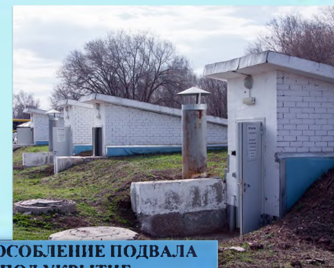
ПРИСПОСОБЛЕНИЕ ПОДВАЛА ПОД УКРЫТИЕ